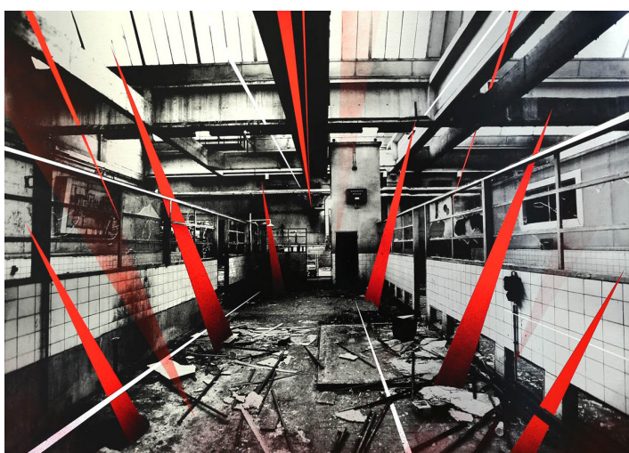
Factory feeling