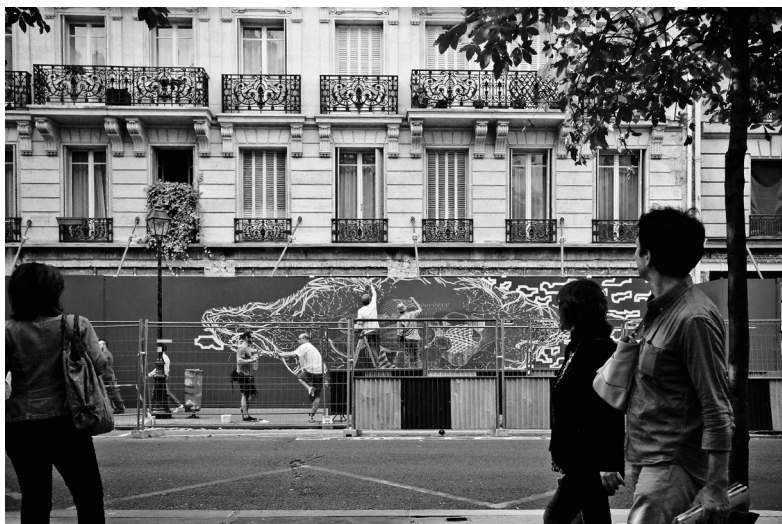
French Kiss Paris2014

K de son nom - assimilable à des traits explosifs et de vitesse. L'œuvre finale, complexe, se caractérise par une composition dynamique et contrastée, les flashes de couleurs se confondant avec les gravats et barres métalliques des lieux photographiés, eux bien réels. Aluminium brossé, bois de récupération, verre, Katre s'amuse des supports et du volume en proposant dans ses expositions des installations ou se mélangent photographie, peinture, néons, sangles et gravas.